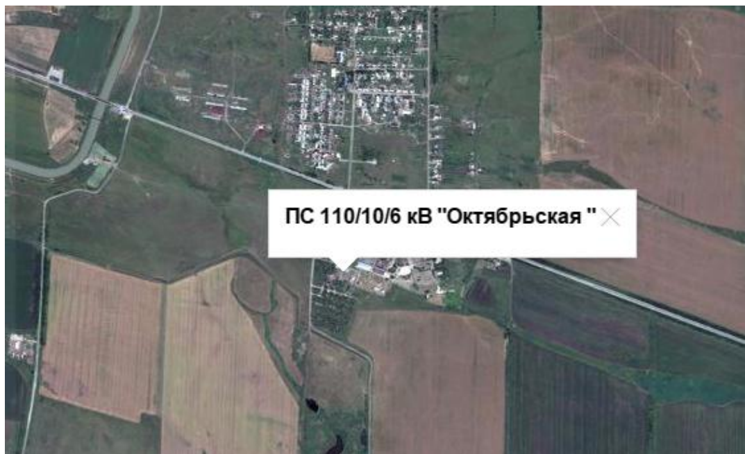
Рисунок 3 Расположение ПС «Октябрьская»

Подстанция "ПС 110/10/6 кВ "Октябрьская ""